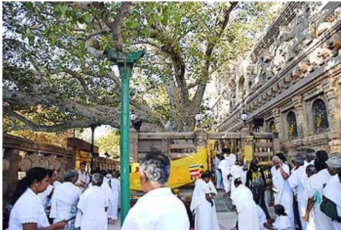
L'arbre bodhi qui servit Bouddha

La première valeur que Bouddha a enseignée au monde, c'est la gratitude. Après avoir atteint l'Illumination, Bouddha contempla l'arbre bodhi pendant sept jours avec une tendresse affectueuse. Il montrait Sa gratitude à l'arbre qui Lui avait offert ombre, abri et protection contre le temps inclément, L'aidant ainsi à atteindre l'Illumination.