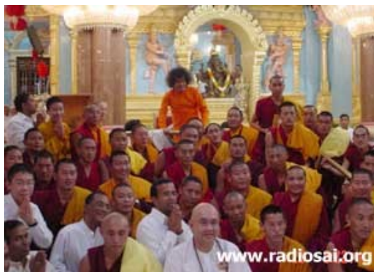
Des moines bouddhistes avec Swami, lors de Guru Poornima, en 2006