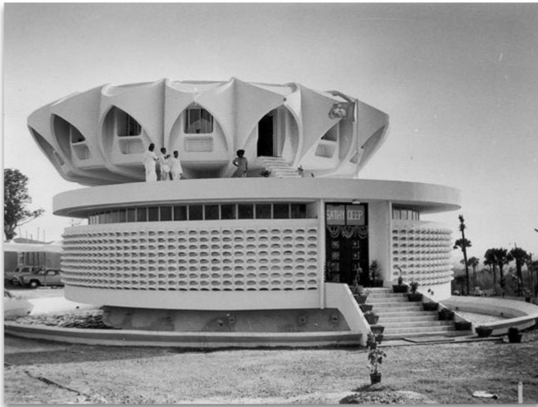
Sathya Sai Baba, lors de l'inauguration du Dharmakshethra à Mumbai, en mai 1968

Je me suis souvent émerveillé de ma bonne fortune, quand Baba a très aimablement planifié dans tous les détails ma participation aux cérémonies de l'inauguration de Son édifice blanc en forme de lotus, le Dharmakshethra, le 11 mai 1968, à Bombay.