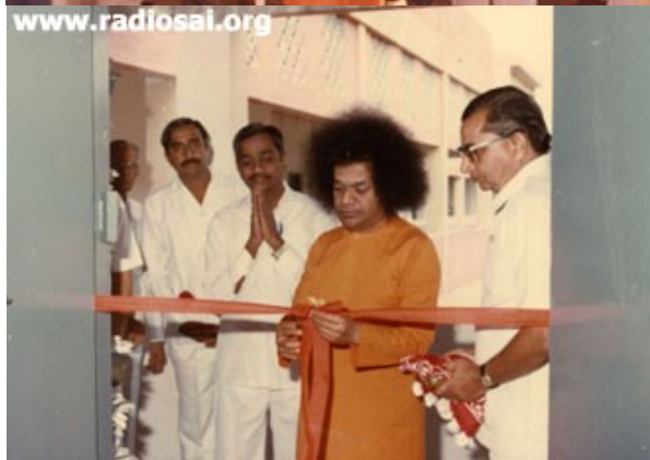
Swami rend visite à l'Institut