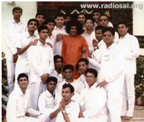
Les étudiants en management avec le

Un soir, Swami demanda à ce groupe de garçons, “Que faites-vous ?” Et ils dirent, “Swami, nous faisons un projet sur les systèmes de qualité ISO 9001.” Swami demanda alors immédiatement : “Qu’est-ce que la qualité ?” Tandis qu’ils s’apprêtaient à donner des définitions tirées de leurs manuels, Swami dit : “Il y a une chose que l’on appelle Total Quality Management (TQM), n’est-ce pas ?” “Oui, Swami”, répondirent les garçons. Alors, Swami se tourna immédiatement vers moi et demanda : “Qu’est-ce que le Total Quality