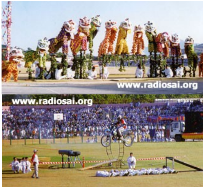
La journée sportive : une démonstration impressionnante de dévotion, de dévouement et d'audace