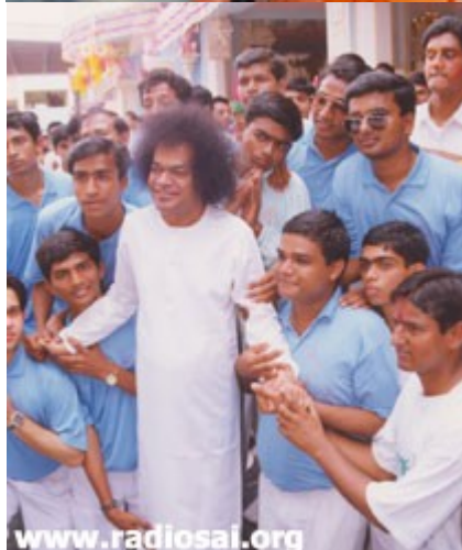
Le Seigneur est venu observer les préparatifs de la journée sportive