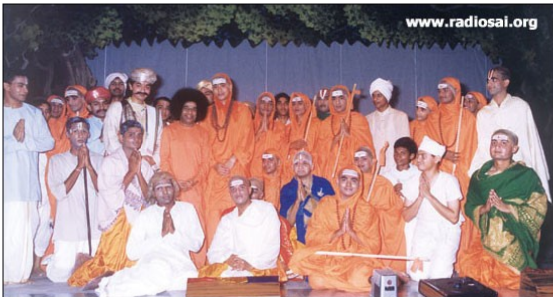
Swami avec les étudiants qui montèrent la pièce Bhaja Govindam