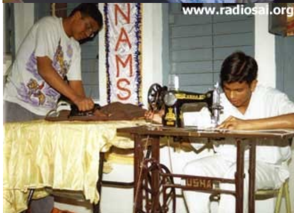
La vie des étudiants consiste à servir leurs frères

Exceller dans tous les domaines de la vie, que ce soit étudier ou coudre !