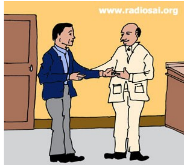
Construire la confiance par la communication