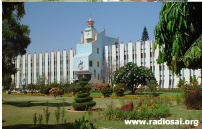
L'Institut Sri Sathya Sai d'Enseignement Supérieur d'Anantapur