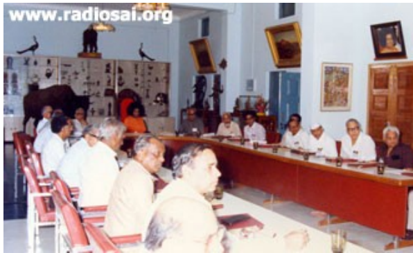
Swami préside une réunion du conseil académique