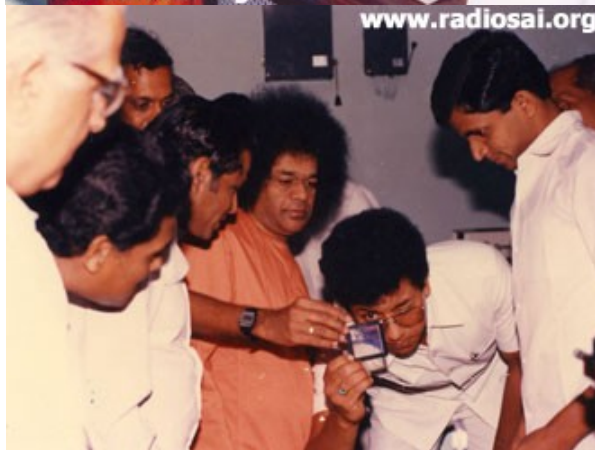
Le laboratoire d'informatique reçoit une visite divine