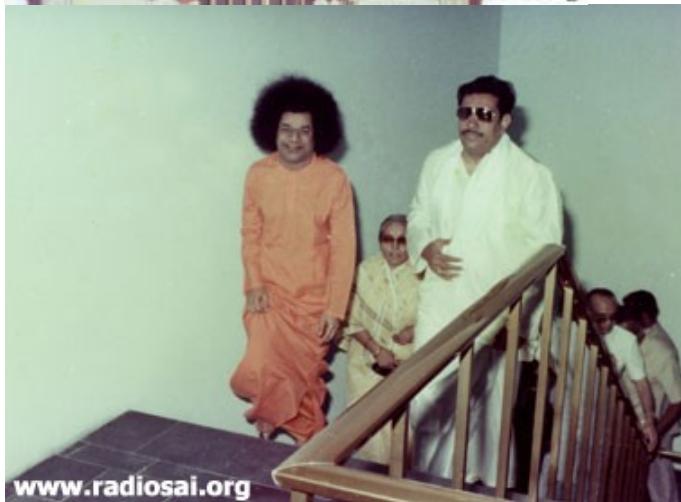
Swami, dans la procession pour inaugurer le bâtiment administratif