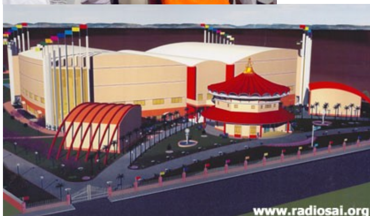
Swami, lors de l’inauguration du Centre Multimédia