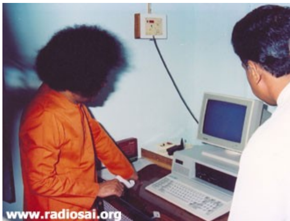
Inauguration du laboratoire de biosciences