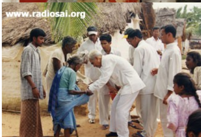
Aimer, c'est donner