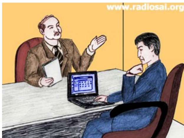
S'accrocher à sa philosophie de travail