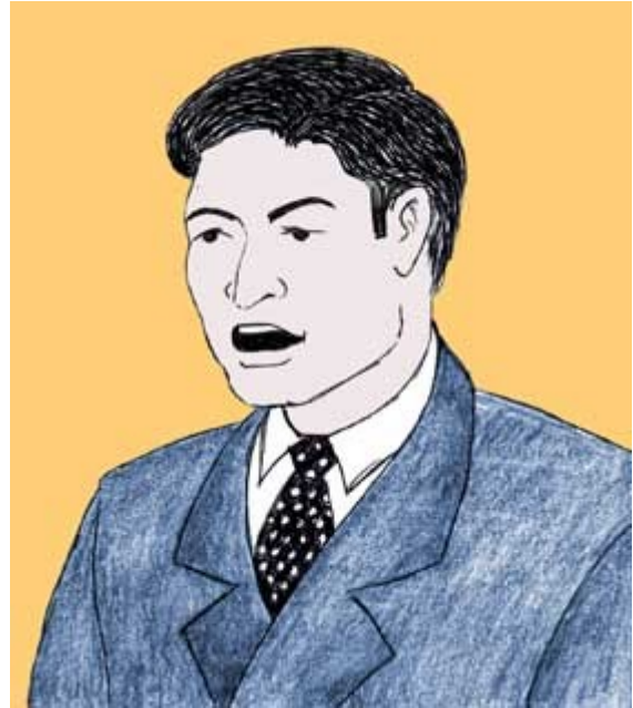
La justice protège les justes

Et puis, environ un an plus tard, quelque chose de très intéressant se produisit. Nous reçûmes à l'improviste un coup de téléphone de la part du même responsable des achats nous demandant de nous présenter le lendemain. Il ne mentionna même pas de quoi il s'agissait – juste un message laconique – “Venez demain à 11h30.”