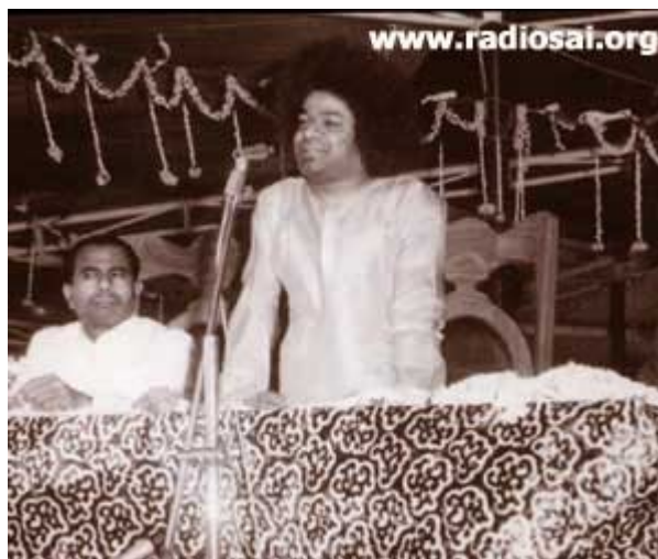
Swami prononce Son discours divin, lors de l'inauguration du campus d'Anantapur

Neuf ans plus tard, lorsque Swami inaugura le Collège Sri Sathya Sai de Prashanti Nilayam, en 1980, Il ne laissa planer aucun doute. Il déclara ouvertement :