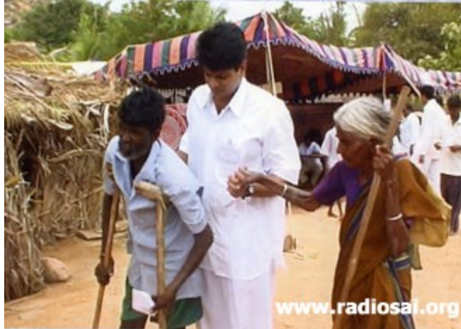
Les alumni Sai apportent de la chaleur, les froides nuits d'hiver