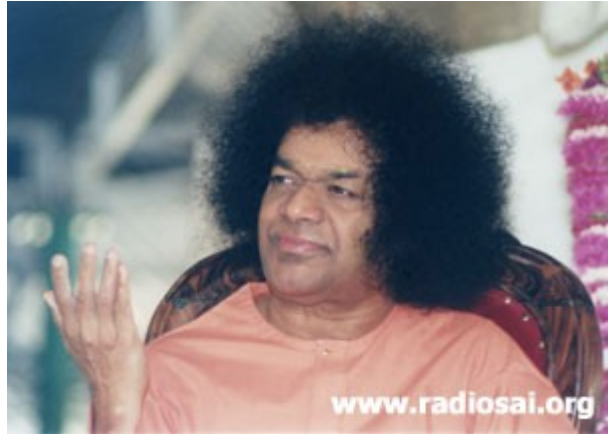
Pourquoi une université supplémentaire ? – Le recteur visionnaire

“Vous savez que l’Inde compte actuellement 108 universités. Cette université est la 109 ème , une de plus que le total traditionnel. Que toutes les universités connaissent le succès et servent le pays convenablement. Mais cette université doit être différente du reste et acquérir un statut unique.”