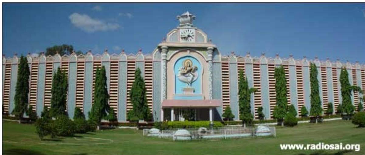
L'Institut Sri Sathya Sai d'Enseignement Supérieur de Prashanti Nilayam

En 1971, en inaugurant le Collège Sri Sathya Sai pour jeunes filles d'Anantapur, Bhagavan dit :