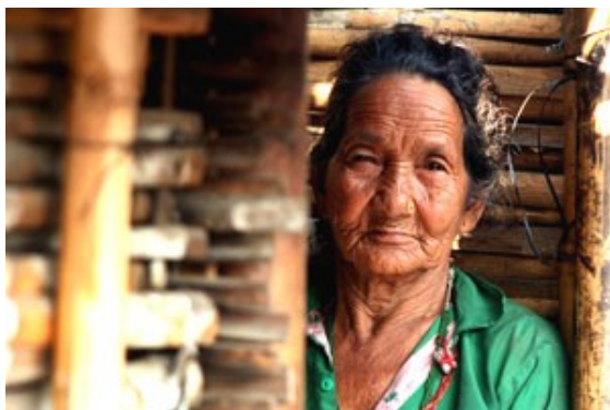
En quarantaine à cause de différences culturelles...