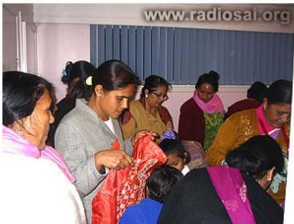
Les dames réceptionnent les colis contenant tout le nécessaire de départ

C’est avec ce sentiment d’unité que les volontaires Sai firent en sorte de rendre la vie de leurs nouveaux frères et sœurs aussi confortable que possible. Pour commencer, ils fournirent à chaque famille un colis de départ qui était basé sur les besoins spécifiques de chaque famille (suivant l’âge, le sexe et la taille de chaque membre de la famille). Ces valises contenaient :