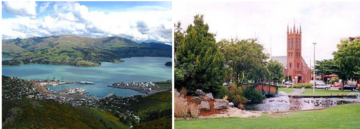
Les villes de Christchurch et de Palmerston North

Le gouvernement néo-zélandais fut d'une grande assistance pour ces familles en leur fournissant des résidences à Christchurch, dans l'Ile du Sud et à Palmerston North, une petite ville de l'Ile du Nord. Le gouvernement mit à leur disposition ces maisons, en dépit de la rareté du logement sur le marché et de devoir satisfaire des familles nombreuses qui comptaient jusqu'à neuf personnes, dans certains cas.