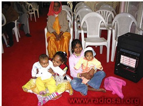
Les mères et leurs bébés ressentent la chaleur de leur nouveau foyer néo-zélandais !

Elle s'était imaginée qu'ils étaient arrivés en Nouvelle-Zélande, mais en réalité, ils avaient émigré aux Etats-Unis. Ceci fut la cause de sa profonde tristesse durant quelques jours, mais elle s'en sortit rapidement. Au cours de leurs derniers jours à Auckland, quand chacun la vit sourire et trimbaler les petits enfants des autres ethnies dans ses bras dans le centre des réfugiés, tout le monde était aux anges. Leur séjour à Auckland avait réellement transformé les réfugiés bhoutanais en de nouveaux Néo-Zélandais heureux !