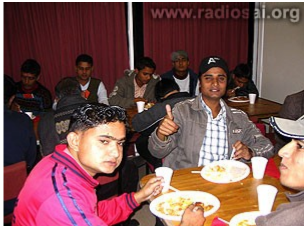
Un bon repas réjouit les esprits !