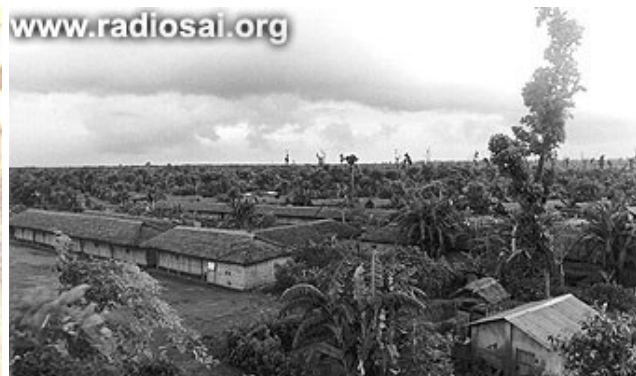
...Forcées hors de leurs foyers à cause de l'idéologie