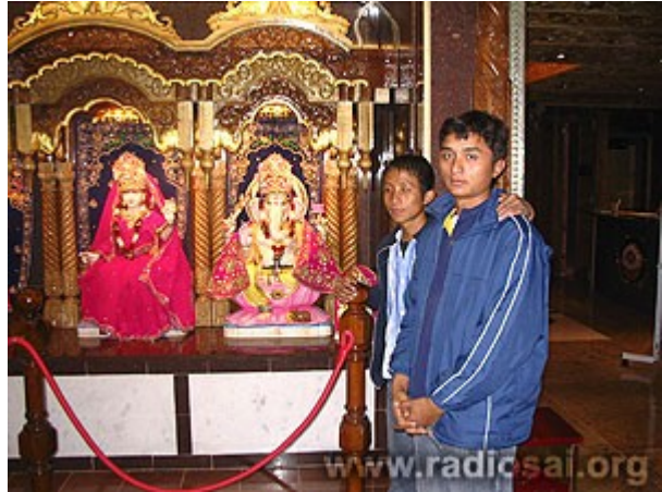
Ici, le dieu Ganesha et la déesse Saraswati