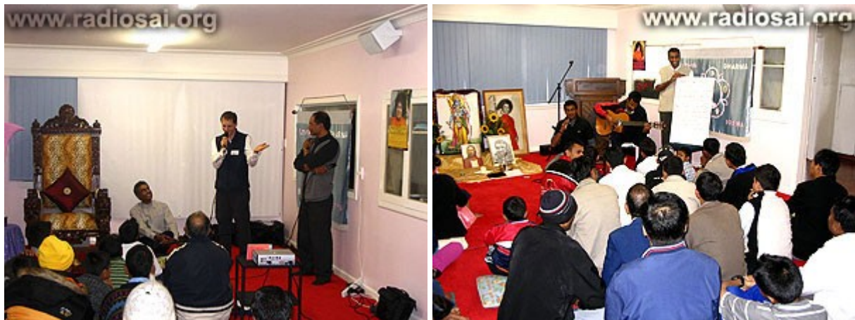
Des séances de partage avec la jeunesse Sai...