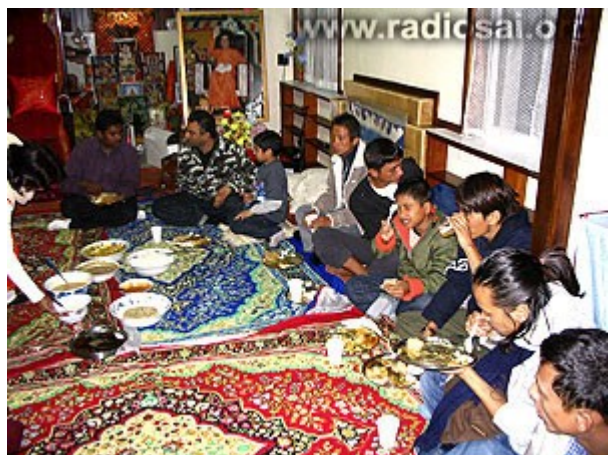
Pour les volontaires Sai, ces invités étaient des dieux !