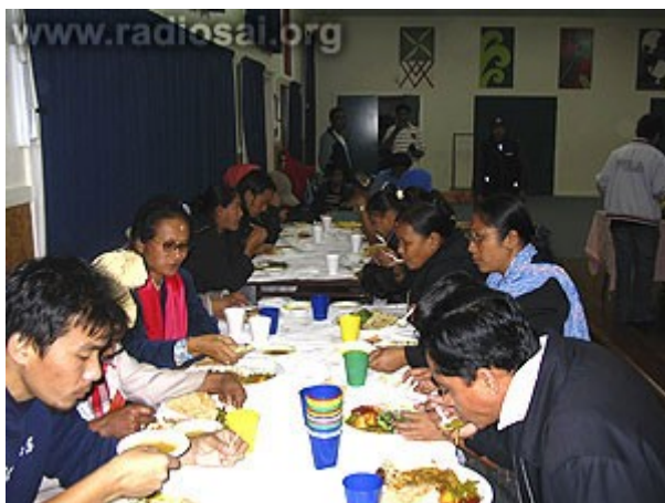
Ils dînaient chaque jour chez des dévots différents