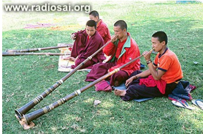
Les vibrations qui sont produites par ces instruments bouddhistes sont formidables et puissantes