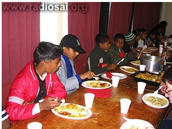
Un peu d'épices dans la nourriture contribua à réduire le choc culturo-gustatif de la langue !

Les dévots Sai étaient déterminés à ce qu'ils se sentent bien et ils organisèrent pour eux une multitude de programmes. Ils commencèrent par leur distribuer des vêtements chauds et par leur offrir de la cuisine indienne et népalaise, puis ils organisèrent des réunions, le week-end, qui incluaient des chants dévotionnels, des danses népalaises, des visites de temples, des jeux et des sports, de la musique et des films inspirants ainsi que des rencontres sur la plage.