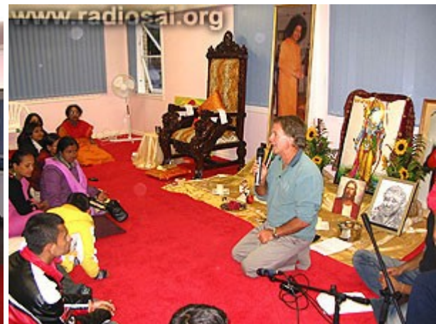
Des séances pour apprendre à mieux se connaître débutent...

Après avoir atterri dans un pays qui leur était totalement étranger, la majorité des Bhoutanais avait non seulement le mal du pays, mais ils étaient aussi mal préparés pour le temps plus froid de la Nouvelle-Zélande, spécialement en hiver. Le plus dur à digérer pour eux, littéralement, fut la nourriture offerte au centre des réfugiés. En fait, beaucoup d'entre eux n'avaient pas non plus mangé la nourriture qui leur avait été servie au cours de leur vol vers la Nouvelle-Zélande, celle-ci étant si différente de ce qu'ils mangeaient depuis des décennies. Tous ces éléments de choc culturel contribuèrent à leur sentiment initial de malaise et de déprime.