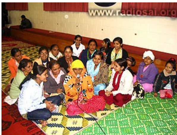
La musique et les chants dévotionnels unissent tous les cœurs !

“Je me souviens qu’une fois, un nouveau groupe de Bhoutanais était arrivé. En fait, je n’avais encore rencontré aucun d’eux, mais un soir, je promenais mon chien près du sommet du Mont Eden – un site touristique très connu de la ville d’Auckland – quand j’ai remarqué un groupe de gens qui semblaient culturellement très différents.