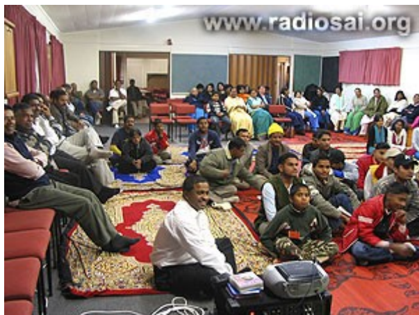
L'accueil se poursuit au centre Sai

Les dévots Sai suivirent vraiment totalement leurs cœurs. Ils communiquèrent étroitement avec les fonctionnaires du service de l'immigration, au centre d'accueil pour les réfugiés et endéans 48 heures (pour leur permettre de se remettre du décalage horaire et de passer les entretiens officiels avec les autorités locales), ils rencontrèrent tous les nouveaux arrivants et ils leur assurèrent que la famille Sai serait leur famille et que les dévots Sai sont leurs frères et leurs sœurs disponibles pour les assister de toutes les manières possibles durant leur séjour au centre.