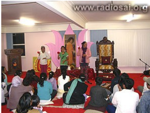
Leur talent pour le chant et pour la danse...