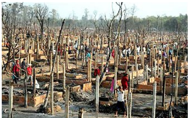
...dans des camps de réfugiés improvisés