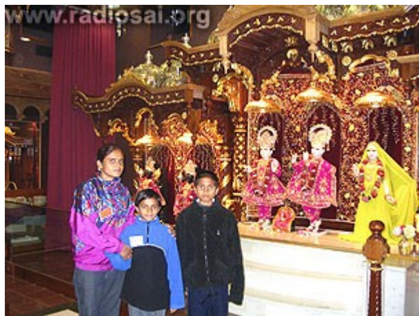
Ils se sentent un peu plus chez eux avec leurs dieux !

Il y a beaucoup de choses que nous prenons comme allant de soi, ici, en Nouvelle-Zélande, mais en voyant avec leurs yeux, nous réalisons combien ces petits actes de gentillesse ont produit une différence remarquable dans leur attitude. Leur vision de la vie, en dépit de leurs problèmes, fut une très grande leçon pour le reste d'entre nous qui vivons des vies relativement confortables.