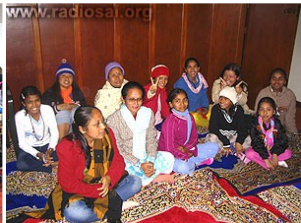
Des Népalaises toutes réjouies dans leurs nouveaux vêtements