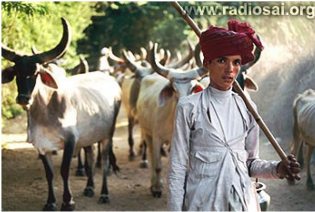
L'agriculture est l'activité principale du pays