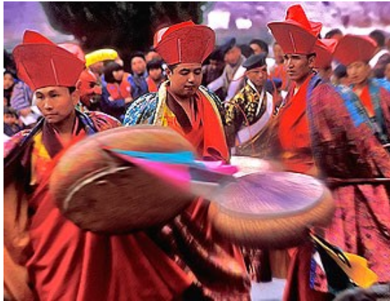
Le bouddhisme est la religion d'Etat

biodiversité dans le monde. Mais le plus intéressant, c'est que Business Week l'a évalué comme le pays le plus heureux d'Asie, en 2006.