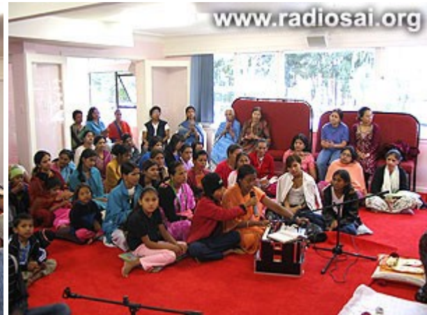
...est quelque chose que tout le monde attend !