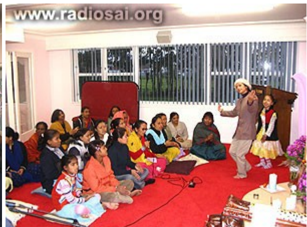
Les Népalais sont régénérés par la joie partagée dans leur nouvelle patrie

Dites cela à n'importe quel volontaire Sai et il ou elle dira : "Pas seulement "New Silent", mais aussi "New Sailand" 2 ! En fait, c'est ainsi que Bhagavan Baba a une fois fait allusion à ce pays. Et au fur et à mesure que les années passent, nous voyons l'amour de Sai qui se manifeste de tant de manières silencieuses, mais toujours éloquentes. L'histoire des Bhoutanais n'est qu'un exemple, et un exemple suffisant pour démontrer la profondeur de l'amour de Sai qui imprègne les cœurs des dévots de ce pays situé à des milliers de kilomètres de Prasanthi Nilayam et la manière dont celui-ci s'exprime de façons multiples, comme le prône Bhagavan Baba.