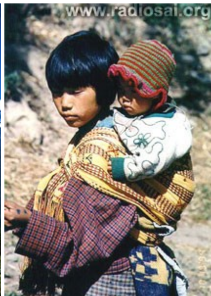
...avec des gens qui travaillent dur et qui aiment la paix

Oui, cette toute petite nation qui n'a pas d'accès à la mer est perchée sur le toit du monde. Niché dans l'est des Himalayas, le Bhoutan est l'un des rares pays du monde où les gens vivent dans une grande harmonie avec la nature et où l'environnement est toujours immaculé, encore aujourd'hui. En fait, le pays a été identifié comme un des 10 "hot spots" de la