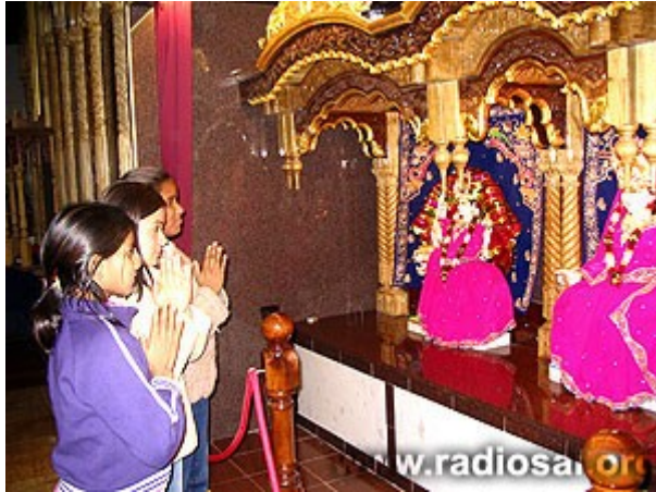
Les Népalais visitent les temples locaux