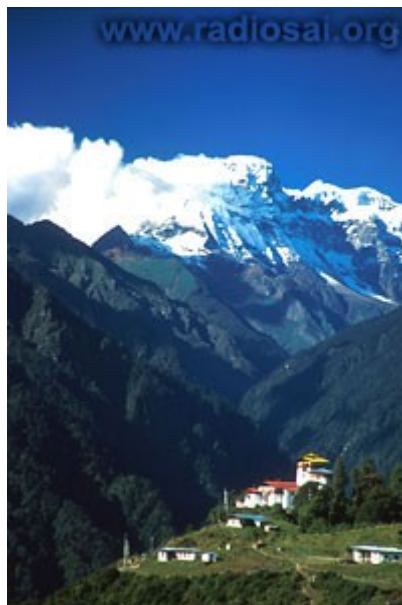
Le Bhoutan, un pays à la grande beauté naturelle...

C'est un pays dont on dit souvent qu'il est "à peine touché par notre époque moderne". Dans cette nation, le progrès ne se mesure pas par le "produit national brut", mais bien, par le "bonheur national brut" ! Les gens de ce pays ont pris d'importantes mesures afin de protéger leur ancienne culture, leurs riches traditions et, le plus important, leur environnement naturel du sommet du monde, littéralement.