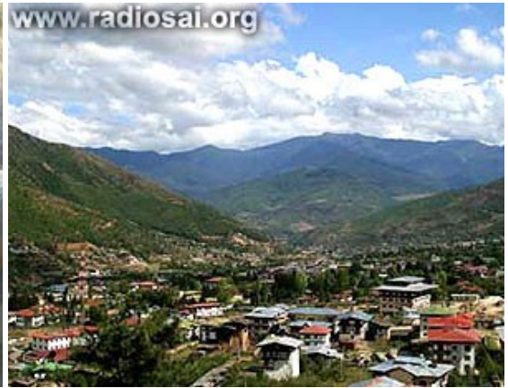
Thimphu, la capitale du Bhoutan, est nichée dans une vallée

Oui, la plupart des Bhoutanais sont heureux et fiers de leur pays et de la manière dont il est gouverné, même si ce n'est que l'année passée, en 2008, que cette nation est passée de la monarchie absolue à la monarchie constitutionnelle.