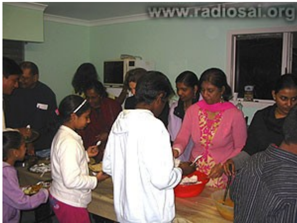
Les volontaires servent avec beaucoup d'amour et de soin les réfugiés