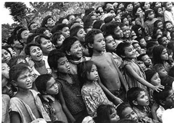
Des milliers de personnes déplacées...

Le Haut Commissariat des Nations Unies pour les réfugiés est intervenu pour aider ces sans-abri et il a entamé des discussions avec les gouvernements bhoutanais et népalais pour fournir un foyer à ces exilés dans l'un des deux pays, mais avec très peu de succès. Cependant, en 2006, le gouvernement américain a généreusement offert de réinstaller plus de 60 000 de ces réfugiés au cours des cinq prochaines années.