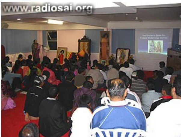
Ils participent à chaque occasion au centre Sai

L'accueil à bras ouverts des dévots Sai non seulement fournit aux réfugiés le soutien émotionnel et matériel tellement nécessaire, mais il leur insuffla aussi le courage et la confiance en eux. Ce qui contribua aussi au processus, ce fut le fait que beaucoup de membres du centre Sai étaient eux-mêmes des émigrés en Nouvelle-Zélande. Quand ils partagèrent leurs propres histoires et quand ils proposèrent des suggestions pratiques, les nouveaux Néo-Zélandais parurent convaincus et rassurés.