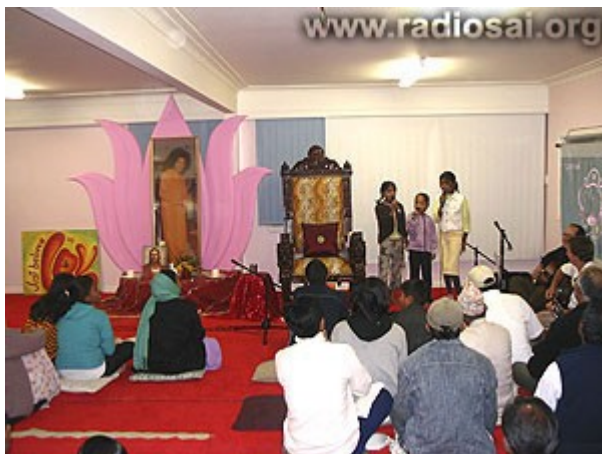
Les enfants participent à tous les programmes culturels du centre Sai