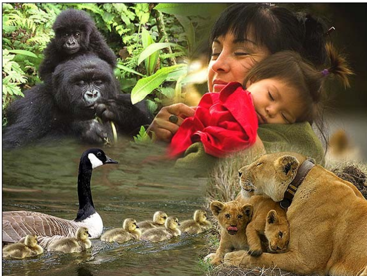
L'amour inconditionnel de Dieu se reflète le mieux dans l'amour maternel pour sa progéniture

Quand j'étais gamin, je pensais que les mères pies y allaient un peu trop fort. Si par inadvertance, je m'approchais trop près d'un arbre où de petites pies étaient en train d'éclore dans un nid en haut, j'étais attaqué par la mère pie. D'autres oiseaux, comme les pluviers, adoptaient les mêmes mesures agressives et protectrices contre les enfants qui risquaient de voler leurs œufs, selon eux. Cet amour chez les êtres humains est aussi fort et dure plus longtemps. Il peut toutefois se contaminer, avec le temps. Il peut se transformer plus en attachement qu'en amour, qui produit des tentacules égoïstes qui contaminent l'amour désintéressé primordial de la mère.