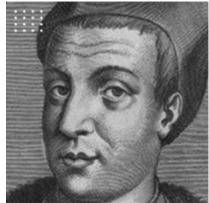
Thomas A. Kempis

“Il est bon pour nous d’avoir des épreuves et de connaître parfois des problèmes, car ils nous rappellent souvent que nous sommes en sursis avec une mise à l’épreuve et que nous ne devrions placer aucun espoir dans aucune chose matérielle. Il est parfois bon pour nous de subir la contradiction, d’être mal jugés par les hommes, même si nous agissons bien et si nous avons le bien en tête.